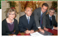
Signature du bail emphytéotique par les deux adhérents

C'est fait ! La ville et la société Extermimo ont signé le 20 octobre 2009 le Bail Emphytéotique Administratif (BEA). La société Extermimo construira la future maison de la petite enfance qui sera mise à disposition de la Ville moyennant le versement de loyers pendant 23 ans.